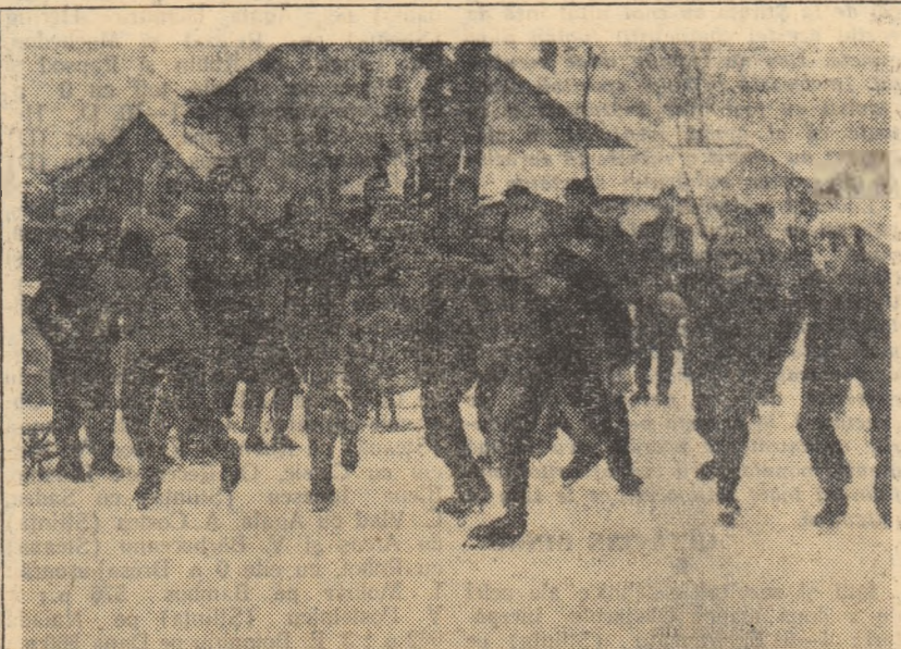
Întrecerile de patinaj în rîndul școlărilor din Petroșeni se bucură de un deosebit succes. Iată un grup de elevi din localitate dispunându-și inițiativa în cadrul Spartachiadei de iarnă a tineretului.

Oamenii sînt însă modești și nu prea vorbesc de munca și de succesele lor. Noi am făcut-o pentru că, într-adevăr, ei merită asemenea aprecieri și pentru că, ne gîndim, exemplul lor ar putea fi urmat de mulți alți activiști sportivi.