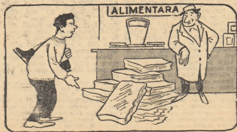
— Nu crezi să-mi dai și mie bucem un metru pătrat de... patinoar? Desena de L. NOVAC

P.S. Am aflat în ultimul moment de ce sfatul popular din Rîmnicu Vilcea a avut nevoie de bani... gheață: cei 5.000 de lei realizați din vânzarea gheții de pe patinoar au fost dați asociației sportive Chimia Goveva, care are echipă de fotbal în „B”. Și e în joc onoarea raionului!