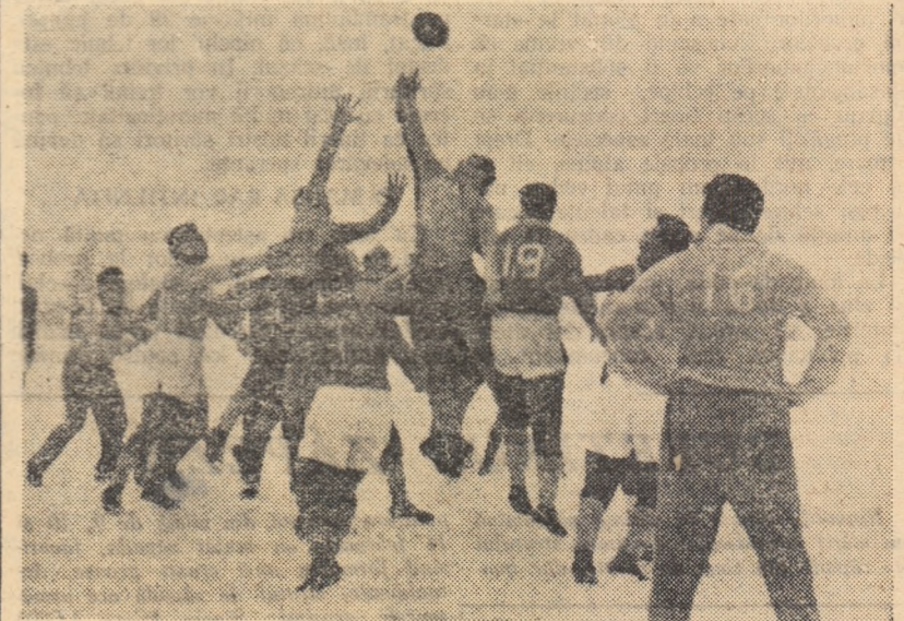
Baloul va fi cîștigat de înaintașii Progresului care vor încerca o „pătrundere” în dispozitivul de apărare al Științei Petroșeni.