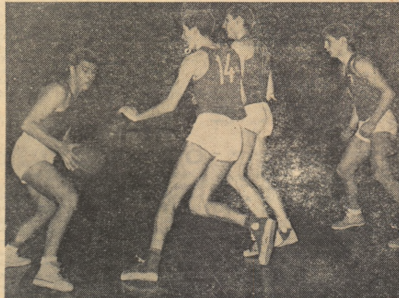
Aspect din jocul Rapid — S.P.G. desfășurat în cadrul „Cupei 16 Februarie”.

Au început întrecerile de baschet din cadrul „Cupei 16 Februarie”. Primele meciuri, desfășurate duminică în sala Giulești, au programat echipe de tineret.