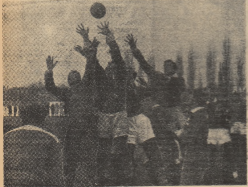
Un „duel“ pe care-l vor câștiga înaintea „Griviței Roșii“. Fază din jocul Steaua — Grivița Roșie.