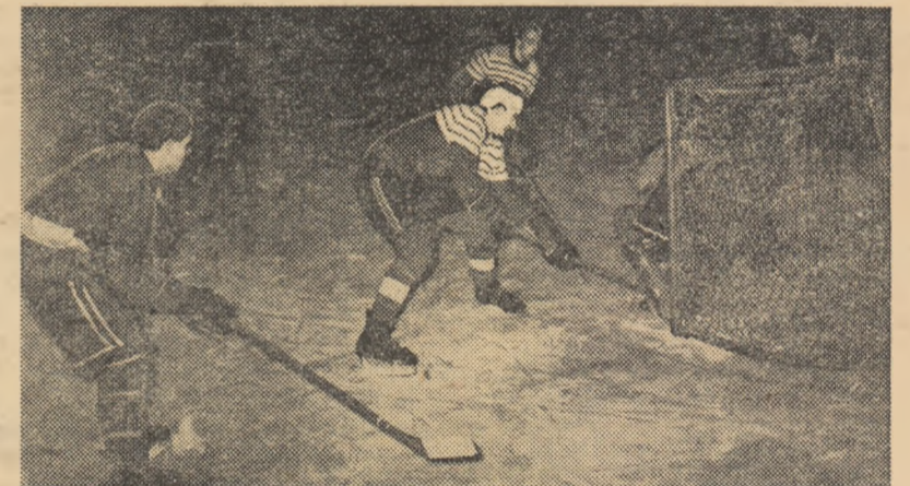
Fază din meciul de juniori Avintul M. Ciuc — I.T.B. (5-5): un atac al echipei bucureștene la poarta oaspeților