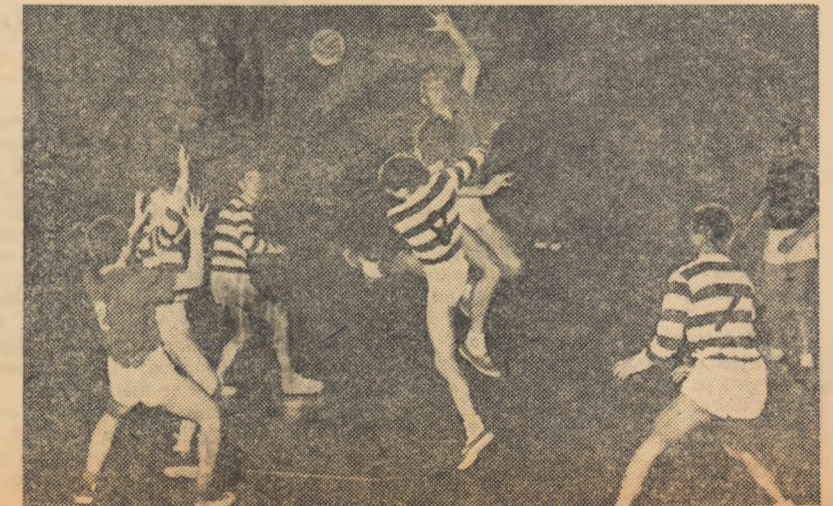
Fază din partida masculină Știința București—Știința Galați, disputată în