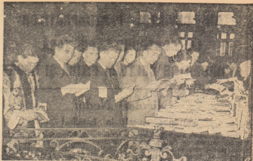
Într-o pauză a Conferinței delegații în fața standului cu cărți.

La baza muncii noastre trebuie să existe o disciplină de fier, liber consimțită. În această direcție la unii activiști din regiunea noastră se manifestă serioase lipsuri, uneori des-