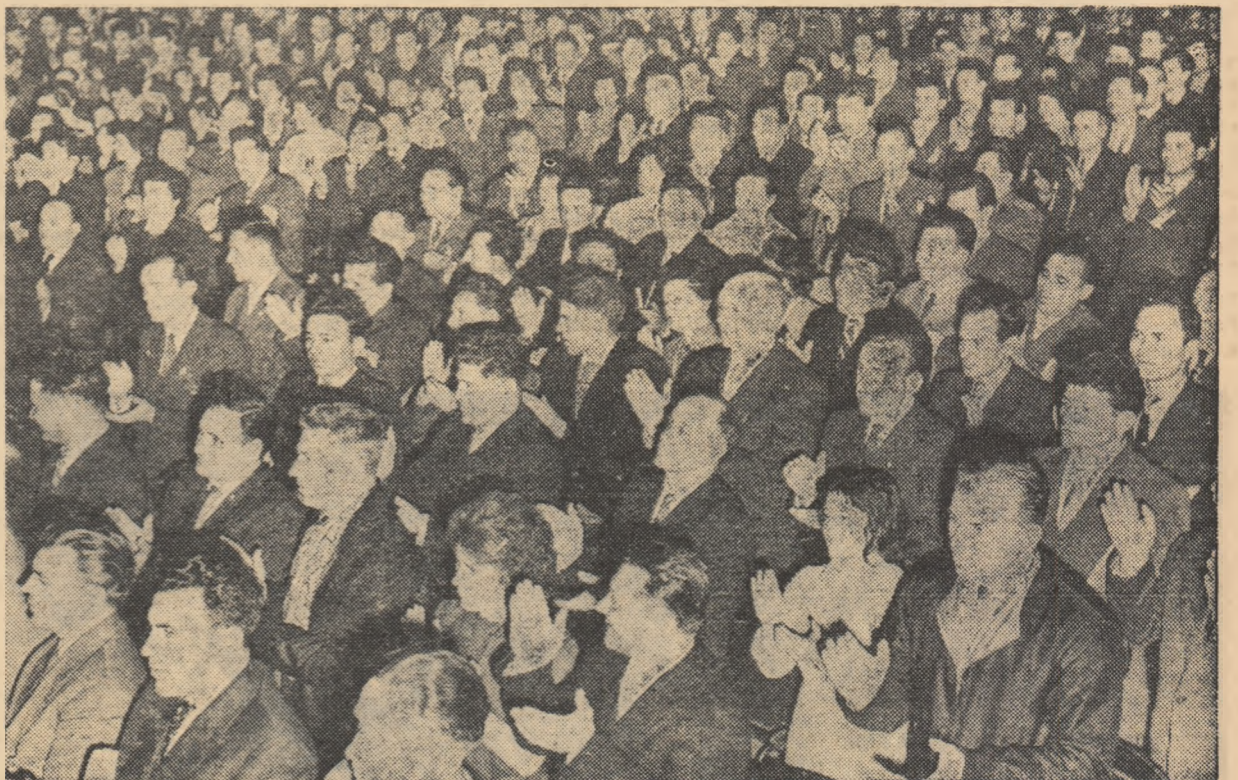
Aspect din sală în timpul Conferinței.

Seara, în sala de marmură a Casei Scintei a avut loc o masă tovarășească cu prilejul încheierii lucrărilor primei Conferințe pe țară a U.C.F.S.