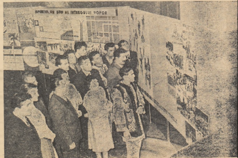
Delegații la Conferință vizitează în holul Ateneului R. P. Romine expziția realizărilor obținute de mișcarea de cultură fizică și sport, de la reorganizare și pînă în prezent.

— nici catedrele de educație fizică nu se ocupă în suficientă măsură de cîmping și de prinderea unui număr cit mai mare de studenți în activități organizate. În multe cazuri cadrele didactice din aceste catedre se mulțumesc doar de pregătirea unei echipe care cuprinde un număr limitat de studenți, pierzînd în vedere marea masă a studenților, mai ales pe studenții anilor III, IV și V.