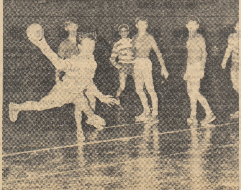
Un salt... și din nou balonul va scutura plasa porții echipei C.S.S. Harghita (Tg. Mureș). (Fază din meciul C.S.S. Cluj - C.S.S. Harghita Tg. Mureș 24-15).

Jocurile continuă astăzi, în sala Floreasca, după următorul program: ora 15: S.S.E. Timișoara - C.S.S. Harghita Tg. Mureș (f); ora 15.55: S.S.E. Ploiești - Tractorul Brașov (f); ora 16.50: S.S.E. Nr. 2 București - C.S.S. Harghita Tg. Mureș (m); ora 16.10: C.S.S. București - C.S.S. Cluj (m).