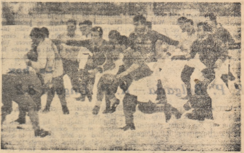
Metalul reușește să stăpenească o nouă grămadă deschisă construită de rugbiștii de la Steaua.