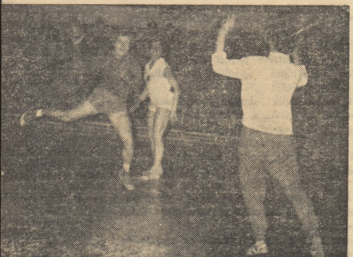
din meciul disputat aseară între Selecționata divizionară și re- na R. D. G.