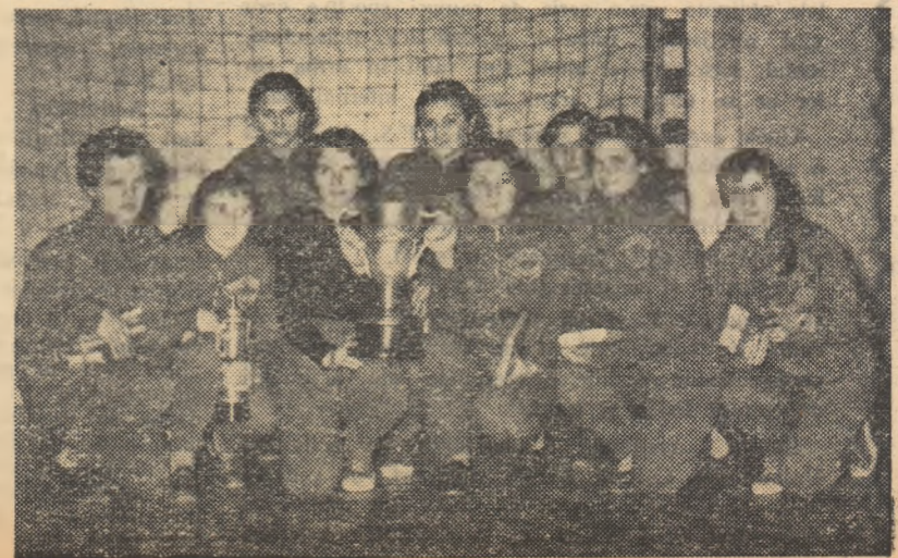
Junioarele de la Tractorul Brașov sînt fericite: au cucerit mult invidiatul trofeu „CUPA SPORTUL POPULAR” la handbal în 7.