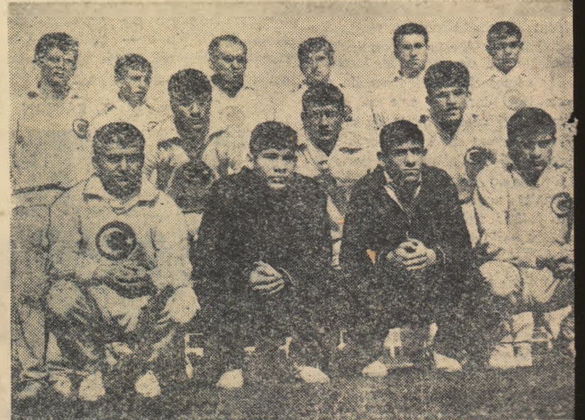
Echipa de juniori a Turciei care a întilnit recent naționala de juniori grecă.

Jucătorii actuali ai echipei de juniori a Turciei sînt din mai multe orașe: Ankara, Istanbul, Izmir, Eskişehir, Zonguldak, Manisa etc. Ei au susținut un meci de verificare împotriva echipei de tineret a orașului Ankara, pe care l-au cîștigat cu 4—1, și un alt joc împotriva echipei de tineret a Izmirului, pierdut cu 2—3. Apoi, în februarie, au întilnit echipa de juniori a Greciei, căreia i-au cedat cu 1—0. Rezultatul a constituit o surpriză pentru specialiștii noștri, dat fiind că în ultimii ani juniorii turci