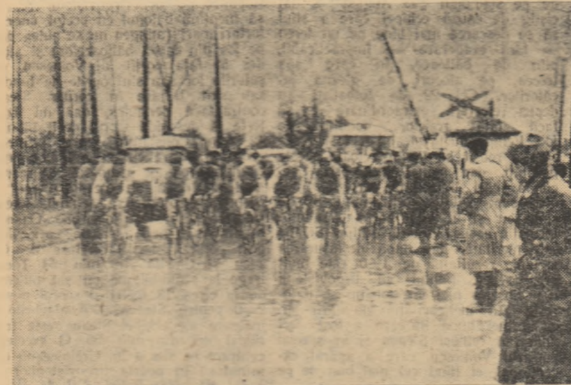
Sunt în concursul desfășurat sîmbătă pe șoseaua București - Urziceni.

Sîmbătă și duminică au avut loc două competiții ciclistice de fond. Prima cursă - desfășurată sîmbătă pe ruta București - Urziceni - București (90