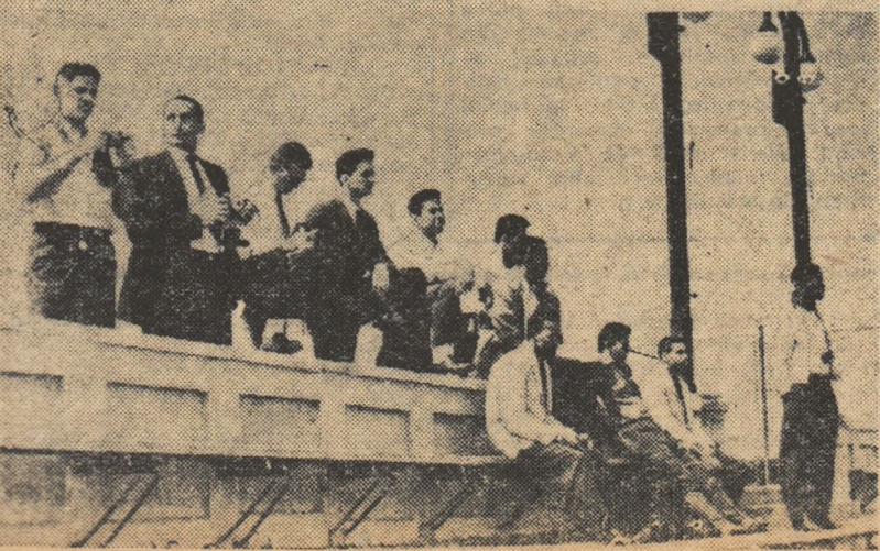
Voleibaliștii din Cuba în vizită la stadionul „23 August”

Aceste lucruri ei le-au demonstrat cu prilejul antrenamentului efectuat miercuri după-amiază în sala Floreasca. Primul joc al oaspeților va avea loc joi, tot în sala Floreasca, de la ora 19.30, în compania echipei Progresul București. În deschidere, la ora 17.30, un meci de baschet între lotul reprezentativ și o selecționată divizionară.