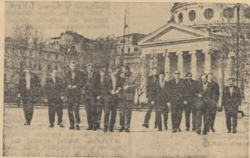
E plăcut să ai o amintire din Bucureștiul aflat în plină primăvară. Baschetbaliștii reprezentativei R.S.S. Ucraineană au profitat de zîna însorită de ieri și s-au fotografiat în fața frumoasei clădiri a Ateneului Român.

este destul de dificilă. De aceea, baschetbaliștii romîni vor trebui să lupte cu toată hotărîrea, să folosească toate cunoștințele lor, pentru a obține performanțe cit mai bune.