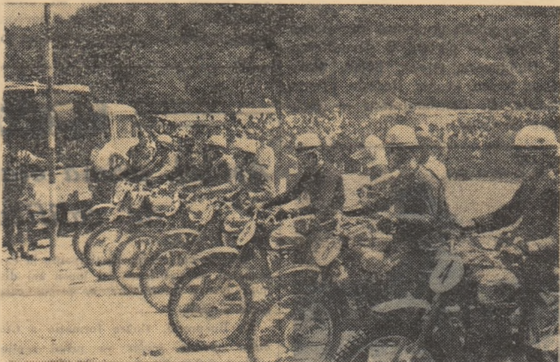
Concurenții clasei 350 cmc s-au aliniat la start și atenți cu motocicletele ambalate, așteaptă semnul luminos pentru plecarea în cursă. Aspect de la prima etapă a concursului internațional.

cele două faze va totaliza cel mai mic punctaj. În ziarul de luni am publicat primele cinci locuri din clasamentele celor patru probe. Iată acum situația în clasamente de la locul 6 în jos: 125 cmc: 6. Al. Schuler (Cimpina); 7. St. Stancev (R.P.B.); 8. Boris Pamfirov (U.R.S.S.), 9. I. Szasz (tineret); 10. Al. Ionescu (tineret); 11. D. Manea (individual); 175 cmc: 6. Boris Pamfirov (U.R.S.S.); 7. M. Termentu (tineret); 8. Ș. Ionescu (individual); 9. L. Szabo (indiv.); 10. I. Romanov (U.R.S.S.); 11. E. Szasz (Cimpina); 250 cmc: 6. E. Kerestes (Brașov); 7. O. Stephani (Cimpina); 8. P. Pencev (R.P.B.); 9.