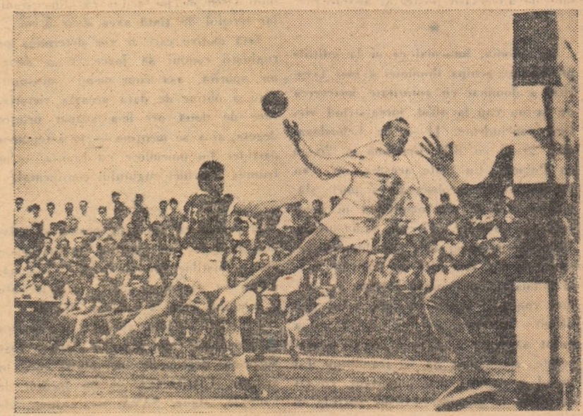
Fază din meciul Dinamo București—Știința Timișoara, disputat sîmbătă după-amiază la Ploiești.