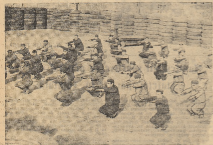
Ca în multe alte întreceri din Capitală, cele câteva minute de gimnastică în producție — executate zilnic — sînt bine venite pentru muncitorii Combinatului de cauciuc Jilava. Pe platoul din fața halelor, se execută, sub îndrumarea instructorului, exercițiile fizice adecvate specificului de muncă.