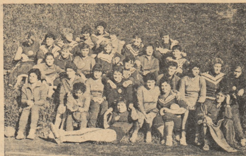
O amintire de la Iaroslav. Echipele feminine de handbal ale R.P. Romine și R.S.F.S. Ruse într-un moment de relaxare.