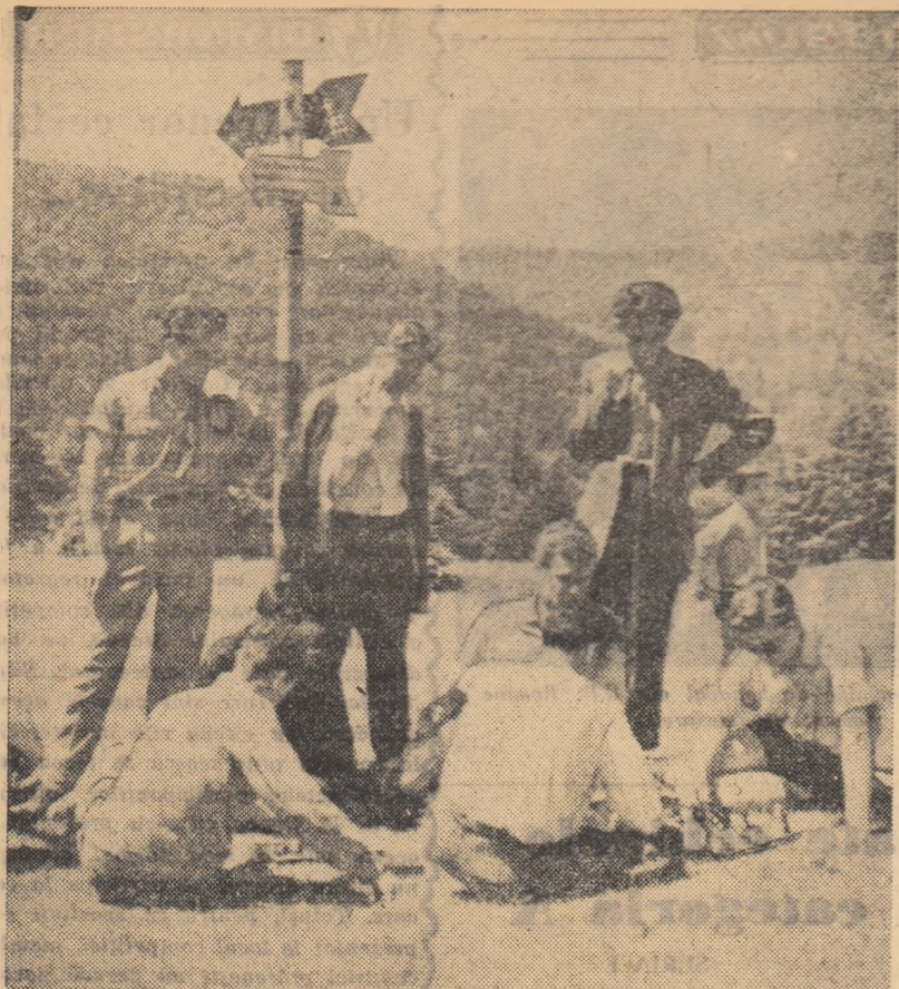
Scurt popas pe cărări de munte...

ANUL XVIII—Nr. 4048 ● Joi 14 iunie 1962 ● 4 pagini 25 bani