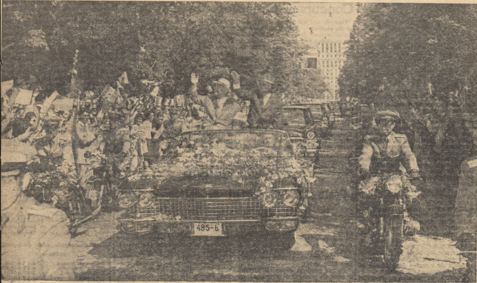
Pe străzile Capitalei