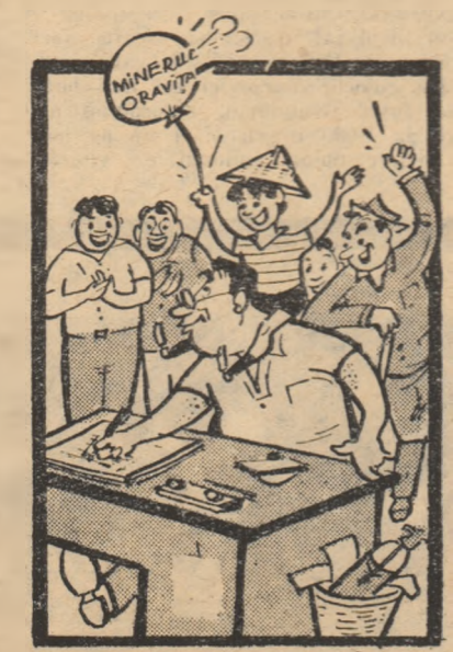
Desen de Neagu Rădulescu

cut cu vederea aceste abateri ale jucătorilor și unor spectatori din Oravița. Citînd acest „raport” ne-am dat seama că ați greșit profund. Ați semnat o contestație a echipei Mi-