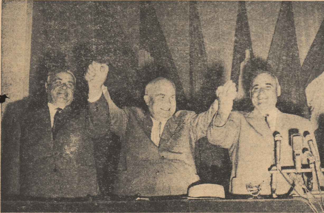
Mină în mină, tovarășii N. S. Hrușciov, Gheorghe Gheorghiu-Dej și Ion Gheorghe Maurer răspund aclamațiilor furtunoase ale participanților la miting

Pe stadionul Republicii din Capitală a avut loc duminică după-amiază un grandios miting consacrat vizitei în țara noastră a delegației de partid și guvernamentale a Uniunii Sovietice.