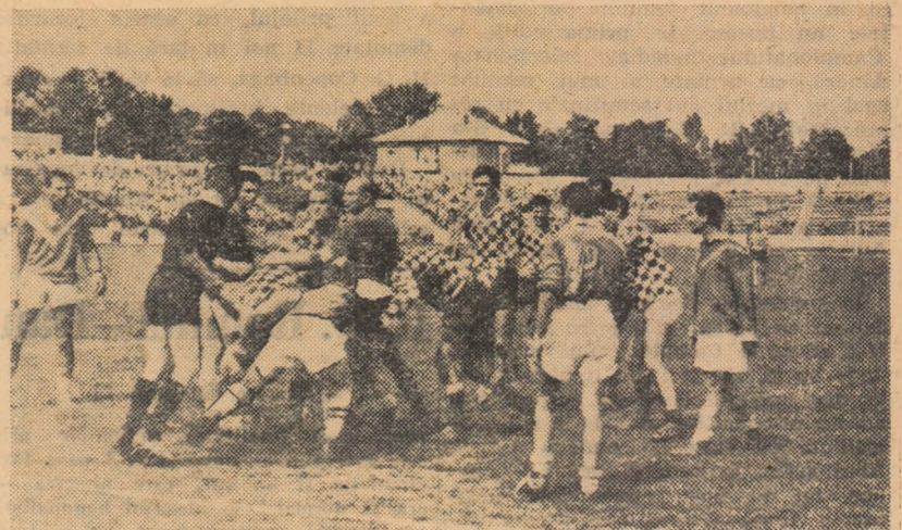
Rugbiștii ieșeni evoluează din nou în Capitală, întîlnind formația Unirea (fuză din jocul C.S.M.S. Iași—Metalul).