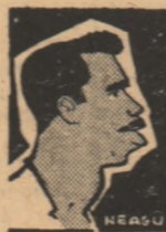
H. Timiseia (Indonezia)

Astăzi la Ploiești: Petrul — Indonezia Miine la București: Rapid — Admira Viena Și la Cluj: Știința-Metropol (Brazilia)