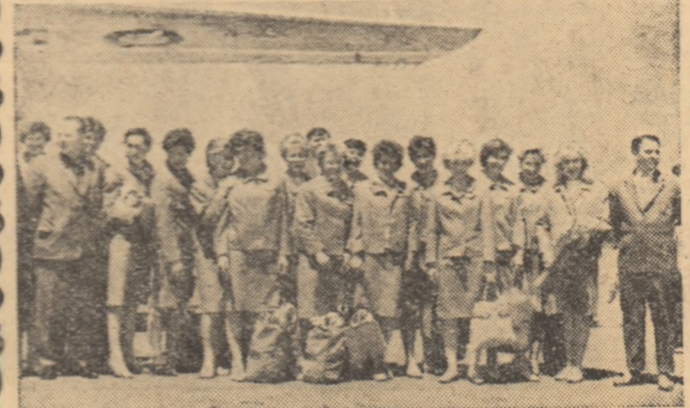
Lotul handbalistelor sovietice la sosire, pe aeroportul Băneasa