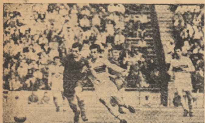
Fază din ultima întâlnire dintre Rapid și Steaua