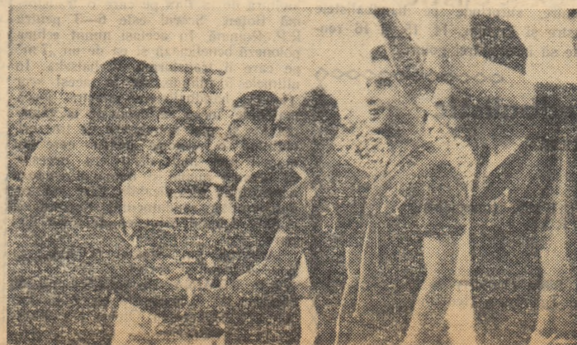
Momentul la care au visat, desigur, toate cele 2000 de echipe participante la întrecerile din Cupa R.P.R.

țime, care oricum este altceva decît o competiție la care participă cinci echipe. În afară de aceasta, gazdele noastre se prezentau cu o serie de rezultate care ne-au dat puțin de gîndit și în plus beneficiau de avantajul terenului, al obișnuinței cu căldura de-a dreptul sufocantă din Grecia. Căci să concurezi pe o căldură de 38 de grade nu este un lucru prea ușor!