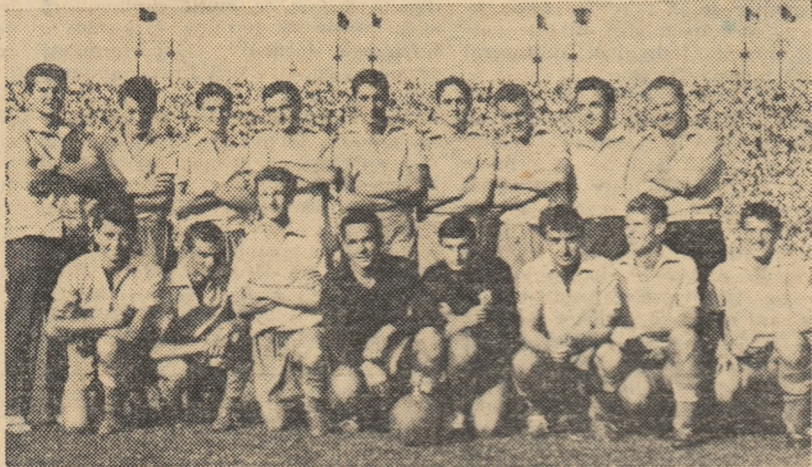
Echipe de juniori Farul Constanta, campioană republicană pe anul 1961-1962