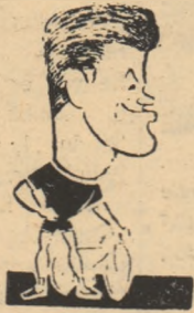
STAPS (R. D. G.)

◆ Sportivi de valoare din 6 țări sînt prezenți la startul întrecerilor ◆ În prima zi se desfășoară probele de viteză, urmărirea individuală, cursa italiană și 1.000 m. cu start de pe loc ◆ Concursul se deschide miine la ora 16,30