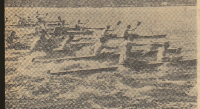
Maestrii europeni ai padelei care vor evolua la Regata Snagov vor angaja, desigur, întreceri la fel de dinamice și spectaculoase ca cele din imaginea de mai sus...

orită puternicelor reprezentanțe ale oaspeților, situate de ori pe primele locuri la Jocurile Olimpice, campionate mondiale sau europene. Vom avea urmări evoluțiilor reputaților sportivi și sportive din U.R.S.S., R.S. Cehoslovacă, Ungară ca și cele ale forțurilor masculine din R.D. Germană și R.P. Bulgaria. Așri de ei, cei mai buni caiaciști, caiaciste și canoaiști din noastră se vor strădui să înțreacă mai spectaculoasă și totodată să confirme valoarea ridicată a sportului românesc la pagaia de la noi. Să uităm că la ultima ediție