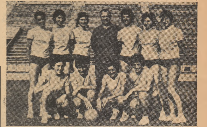
Echipa de volei fete a țării noastre care va participa la întrecerile de la Helsinki

Telegramele primite din capitala Finlandei ne vestesc desosirea primelor grupuri de sportivi din diferite colțuri ale lumii. Sînt așteptați să sosească în aceste zile la Helsinki și