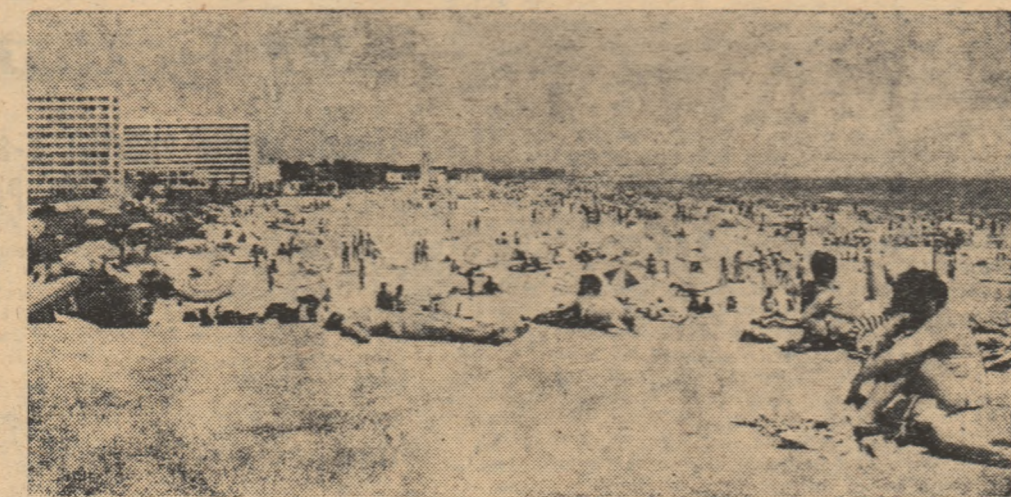
Mamaia — una dintre perlele litoralului Mării Negre. Policromie și croială măiastră în beton și sticlă, plajă pudrată... cu cel mai fin nisip, iată ce oferă Mamaia celor aflați aici la odihnă.