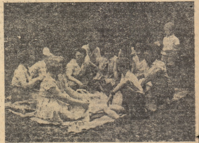
Poști bună! Familia, destul de numeroasă, se pregătește să ia masa, din al cărei meniu nu lipsește nici berea.