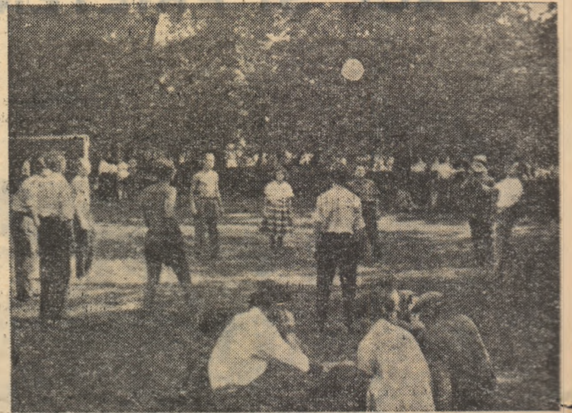
Unii joacă șah, alții volei, fiecare după gustul și priceperea sa.