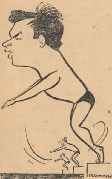
MIRCEA CAPRĂRESCU (Steaua) văzut de Neagu Rădulescu

Astăzi, la ora 10, se va da startul în prima probă a campionatelor republicane de înot și sărituri pentru juniori; după cursa de 100 m fluture, feminin, vor urma altele (eliminările) care vor avea, rind pe rind, marea număr de concurenți prezenți la finale din toate centrele de natație ale țării.