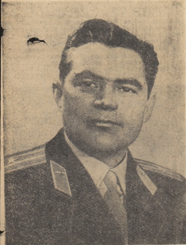
ANDRIAN GRIGORIEVICI NIKOLAEV