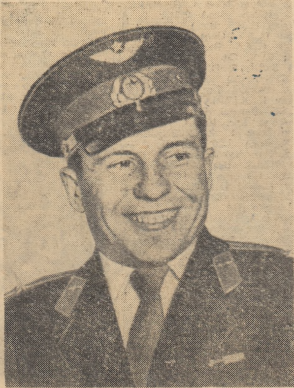
PAVEL ROMANOVICI POPOVICI

MOSCOVA 11 (Agerpres). — TASS transmite: La 11 august 1962 ora 11,30 (ora Moscovei) în Uniunea Sovietică a fost plasată pe o orbită circumterestră nava cosmică satelit „Vostok-3”. Nava „Vostok-3” este pilotată de maiorul Andrian Grigorievici Nicolaev, cetățean al Uniunii Sovietice.