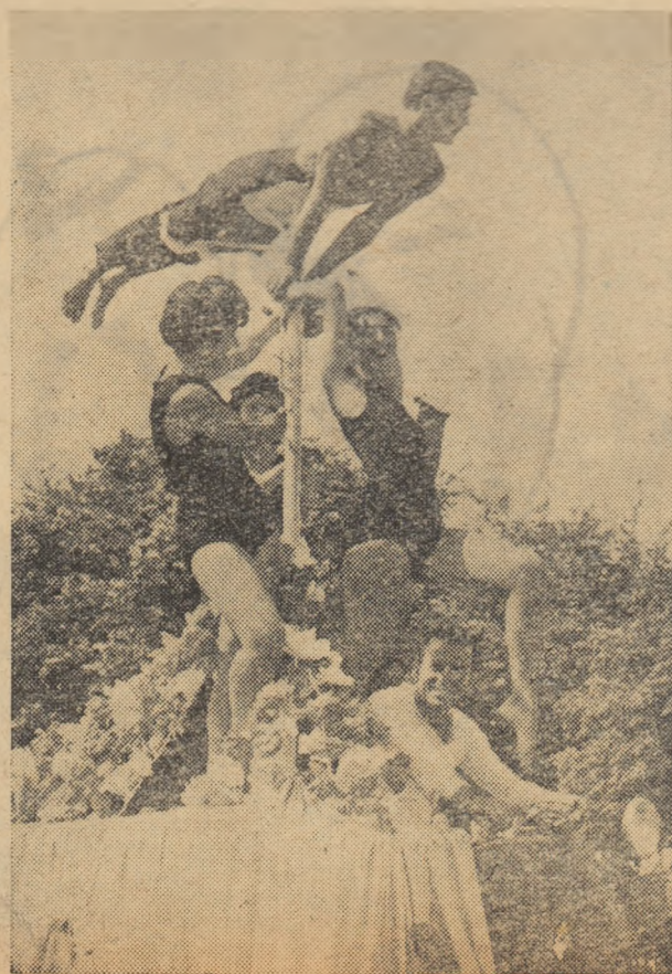
Un buchet de tinerețe