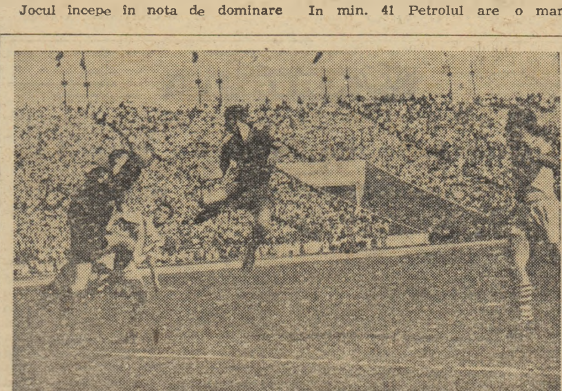
Ghiță, portarul dinamoviștilor băcăoani, a prins mingea la timp. Voinca era pe aproape...