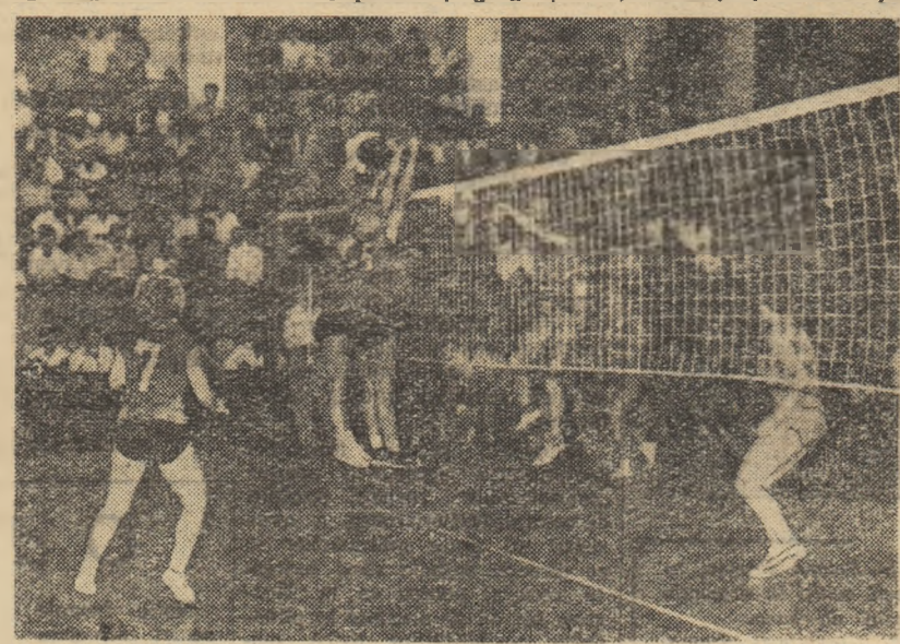
Nada Spelinova (R.S.C.) a „spart” blocajul nostru, dar Sonia Colceriu (nr. 7) este gata să intervină. (Fază din meciul R.P.R. I—R.S.C. 3—2)

astfel: 1. R.D. Germană 1,74 m; 2. R.S. Cehoslovacă 1,73 m; 3. R.P. Ungară 1,71 m; 4. R.P. Română 1,70