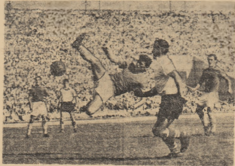
Printr-o „foarfecă” spectaculoasă, Motroc rezolvă o situație dificilă la poarta lui Dungu. Eftimie, care așteaptă balonul, nu mai are ce să facă...

Arbitrul N. Mihalăscu a condus formațiile: