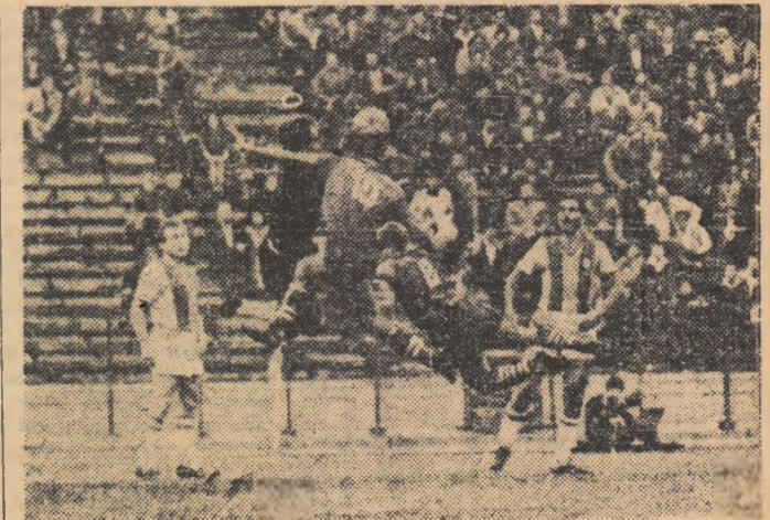
Turgav „cudege“ balonul spre care sărise în același timp Esti-mie și Tircovnicu