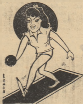
ELENA LUPESCU componenta lotului țării noastre

A V-a ediție a campionatelor mondiale de popice se desfășoară la Bratislava între 24—30 septembrie.