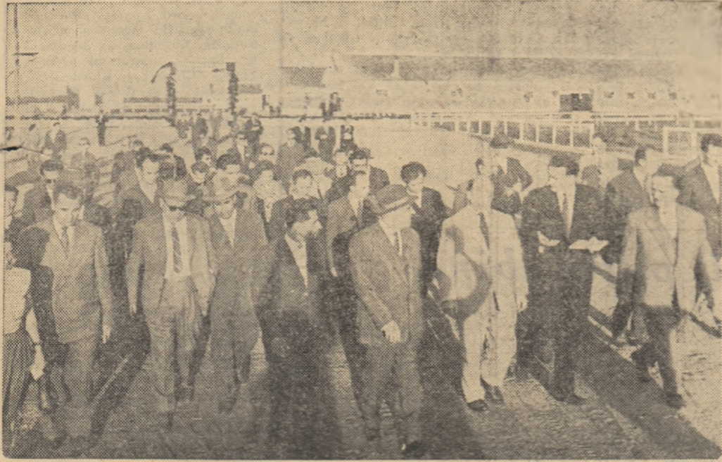
Vizita delegației de partid și guvernamentale a R.D. Germane la colectivității din Hărman