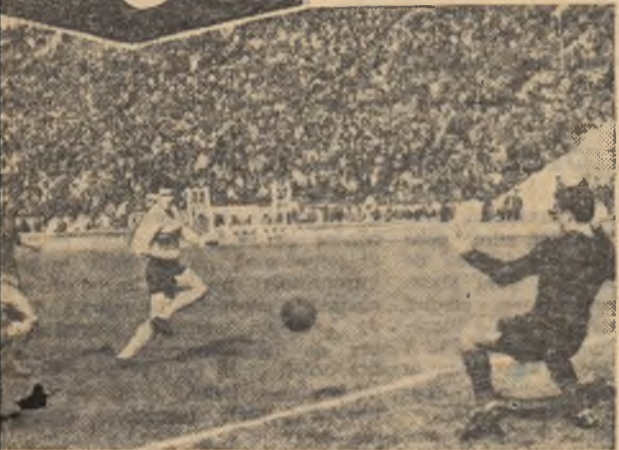
atac rapidist la poarta echipei militare. (Fază din meciul tineret Rapid — Steaua, disputat pe stadionul 23 August).

ANUL XVIII — Nr. 4107 ★ Marți 25 septembrie 1962 ★ 8 pagini 25 bani