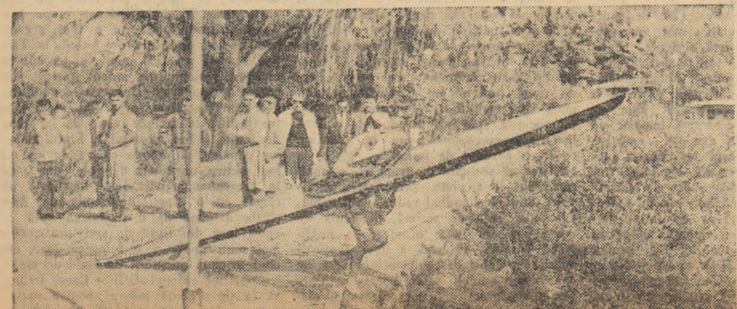
Dovănită tradițională, competiția „Traversarea iacurilor” — desfășurată duminică — a stîrnit un deosebit interes în rândul iubitorilor sporturilor nautice. În clișoul nostru, unul din concurenții a