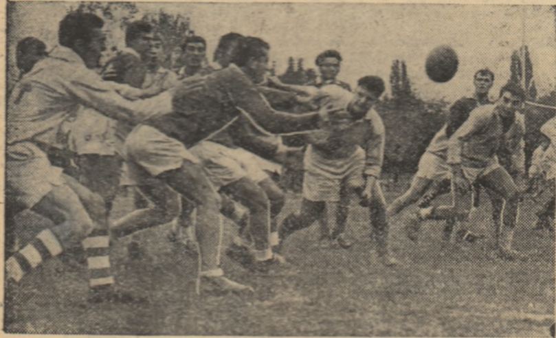
Fază din meciul de verificare a lotului republican de tineret: o acțiune frumoasă pe contraatac, dar care se va solda, în cele din urmă cu o... repunere din margine...