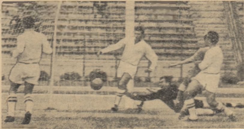
O fază din meciul dintre Selecționata de tineret și Selecționata categoriei B.