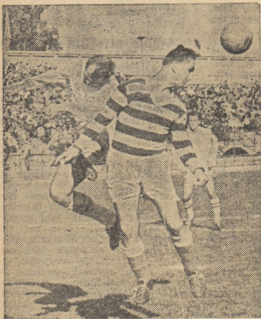
„Duel” spectaculos între Caricaș și Zgardan. Cîștigă stoperul echipei bucureștene

Atracția „deschiderii” de ieri, de pe stadionul Republicii, a constituit-o, fără îndoială, prezența, din nou, a unor jucători cu perspective din categoria B. Încă o dată, publicul bucureștean și specialiștii au văzut că la porțile categoriei A bat o serie de tineri fotbalisti care trebuie cizlate cu grijă. Considerăm că inițiativa F.R.F. de a alege o selecționată a categoriei B este binevenită.