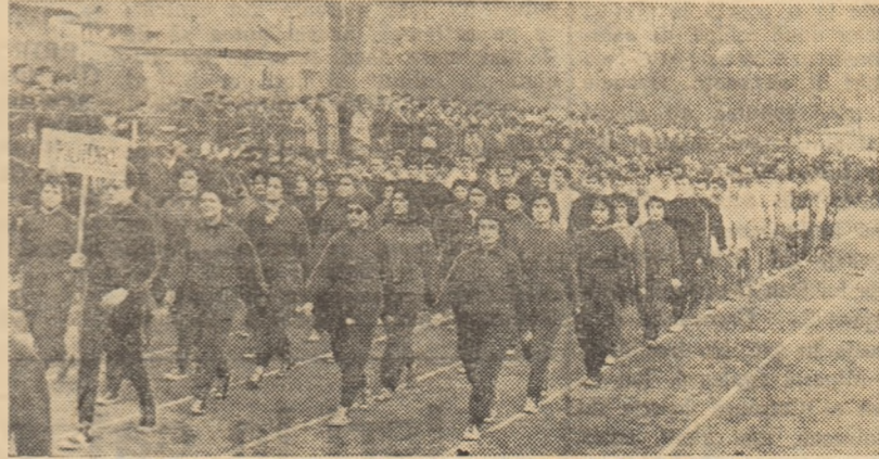
Deschiderea festivă a activității sportive universitare pe anul 1962-1963: prin fața tribunelor trec studenții sportivi de la Institutul Politehnic din București