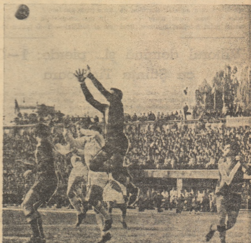
Portarul Suciu va reține balonul. Pentru orice eventualitate, Pei îl dublează. (Fază din jocul Știința Timișoara — Vitorul (3—1))