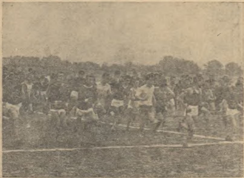
Crosul „Să întâmpinăm 7 Noiembrie“. La start juniorii, cîștigătorii etapei precedente, din raionul Nicolae Bălcescu din Capitală

ANUL XVIII — Nr. 4126 ● Luni 29 octombrie 1962 ● 4 pagini 25 bani