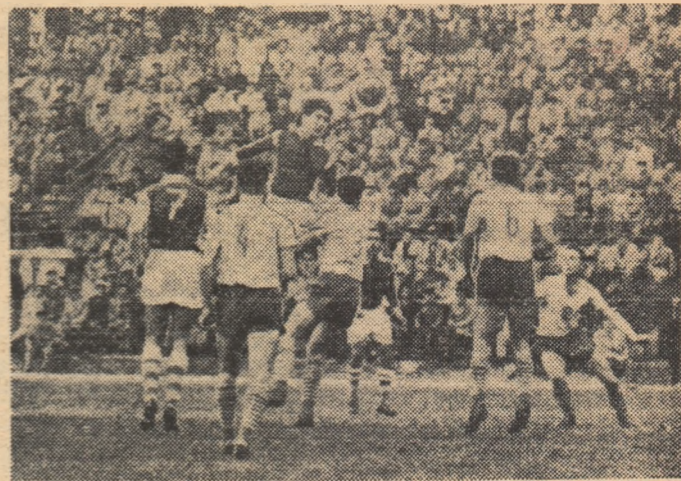
Dridea I s-a înălțat peste ceilalți jucători și reușește să boteze poarta lui Wergang. Acesta însă, va bloca balonul cu ușurință. Fază din meciul Petrolul — Sel. Leipzig, 1-0

centru. Această netă dominare a fost însă exasperantă prin sterilitatea ei, prin inghesuala jocului, prin excesul de pase