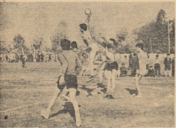
Sărbătoare sportivă în comuna Tudor Vladimirescu din regiunea Galați. Satul tot, cu mic cu mare, și oaspeții veniți de aproape și de departe, au făcut gard viu în jurul terenului de sport. Aici s-a întrecut tineretul. Demonstrația de gimnastică, meciurile de volei și de handbal, probele de atletism, au alcătuit programul unei atrăgătoare și mult aplaudate duminici sportive. Prilej de a-și arăta iscusința pentru fețele și flăcăii satului, iar pentru numeroșii spectatori de a urmări întreceri însuflețite. Succesul înregistrat de aceste întreceri a îndemnat pe sportivii comunei să se gîndească de pe acum la organizarea unei noi duminici sportive. Toamna este lungă și frumoasă...