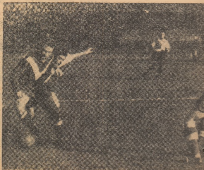
În lupta pentru balon, Ghergheli care a venit în apărare, a cîștigat cu Năsturescu