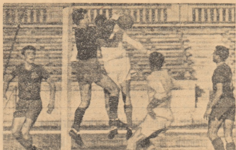
Fază din partida de tineret Dinamo București—Steaua (4-2)

Echipele Miner I și Progresul, aflate la egalitate perfectă, au fost depașite prin rezultatul direct dintre ele (Minerul a cîștigat cu 4-2).