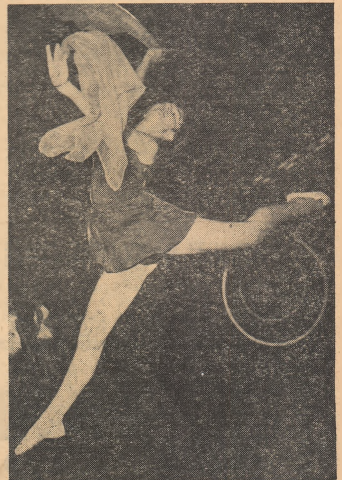
Gimnasta clujeană Rodica Popescu, într-o săritură artistică cu eșarfe.

Iată și programul întrecerilor: ora 9.15: festivitatea de deschi- dere; concurs cu exercițiile im- puse (individual); ora 16.30: concurs cu exercițiile liber alese (individual și ansamblu); fes- tivitatea de închidere.