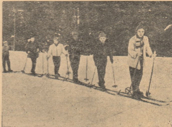
Așa a fost anul trecut. Un grup de elevi din București pe pârțile albe din jurul Predealului, pregătindu-se pentru întrecerile Spartachiadei de iarnă. Acum este așteptată numai zăpada.

nivel (fete), 500 m cu 15 porți și 100 m diferență de nivel (băieți); 17—18 ani — 200 m cu 15 porți și 150 m diferență de nivel (fete), 700 m cu 20 porți și 150 m diferență de