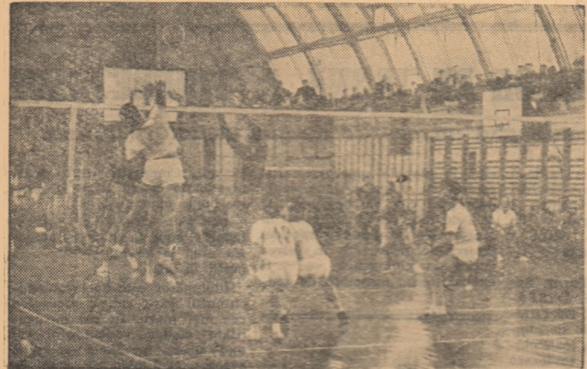
Moment de la unul din ceremonii meciuri Progresul — Steaua, derbiul de volei bucureștene inaugurale a campionatului republican masculin pe anul 1962—1963.

Faza preliminară administrativă a campionatelor nu scoate în evidență însă numai aspecte... neutre sau pozitive, ci și negative. De pildă, cazul echipei feminine a Combinatului Poligrafic București , care figurează în programul primei etape, dar e amenințată cu excluderea din campionat, hotărâre care ar corespunde intrutotul regulamentului campionatelor republicane de categoria A pe 1962—1963. Este vorba de articolul care prevede ca obligatorie pentru echipe participarea în campionatul local cu o echipă de juniori (junioare), sub sancțiunea eliminării din campionat a formației de categoria A după două neapărări comise de echipa de juniori sau junioare. Și echipa de junioare a C. P. București, înregistrând două neapărări, scoaterea sa din competiție a fost hotărârită de comisia orașenească de volei București, ceea ce atrage, în mod normal, și excluderea echipei din categoria A. De loc îmbucurătoare situație. Dar, pe linia acțiunii de primenire și de încurajare a promovării tineretului, care se impune fără rezerve și echivocuri în voleiul nostru, măsura aceasta, de va fi luată, o vom aplauda.