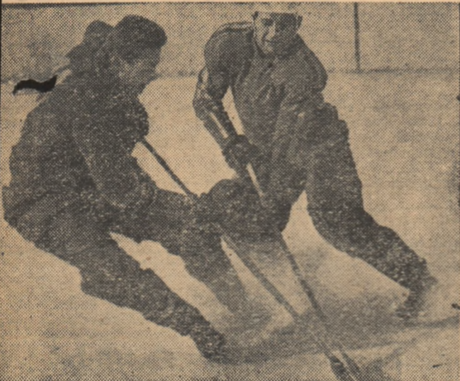
Duel pasionant pentru puc...

veada echipa romine, la un scor strins: 5-3. Hocheiștii francezi, care și-au început în acest an pregătirile mai devreme ca oricând, vrind să confirme locul 2 pe care l-au