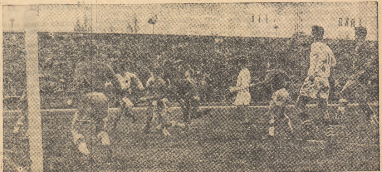
12 jucători (7 de la Viitorul și 5 de la Dinamo) în careul... mic.

Jocurile viitoare la 9 decembrie: Știința Cluj — Steaua, Dinamo București — Șt. roșu, Rapid — Crișana (restanțe).