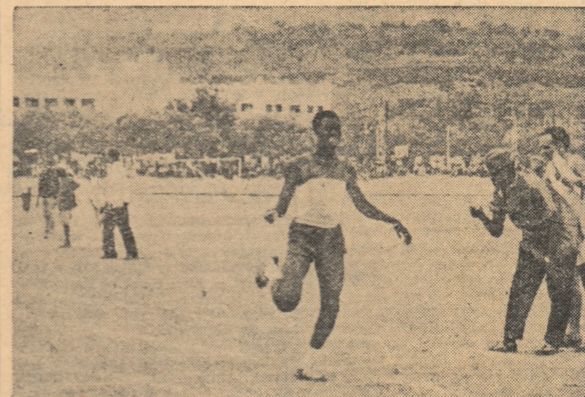
Țările africane eliberate de sub jugul colonial participă acum la întreceri sportive bilaterale și la diferite competiții de mare amploare. Iată un aspect din întâlnirea de atletism Mali—Guinea (90—56) care a avut loc la Bamako: sosirea în cursa de 100 m

Ca să nu mai vorbim și de elementele talentate existente în Uniunea sud-africană, țara discriminării rasiale. Exemplul cel mai elocvent este minerul din Bantu, Shale Elliot, care la un concurs organizat recent pentru cei „de culoare” a alergat 100 yarzi în timpul de 9,5 sec. — adică aproximativ 10,4 sec. pe 100 m plat.