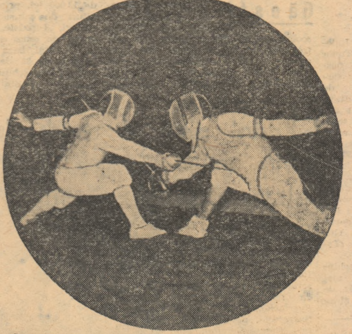
Concursul de scrimă organizat de clubul sportiv Steaua și dotat cu „Cupa a XV-a aniversare a R.P.R.” promite să ofere asalturi spectaculoase, odată celui din fotografia noastră

● Cu cîteva zile în urmă, colectivul catedrei de educație