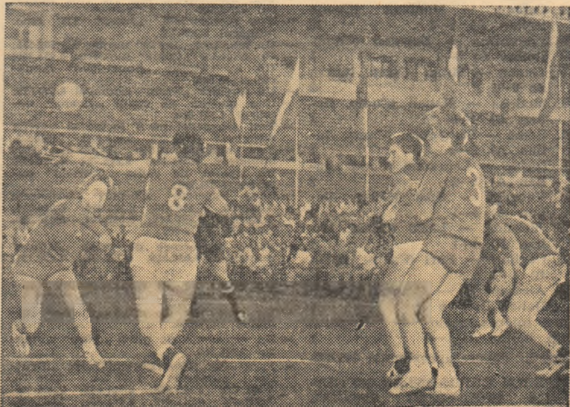
De fiecare dată cînd s-au întîlnit, handbalistele romîne și cele Iugoslave au furnizat meciuri de un ridicat nivel tehnic. Partida — din care vă prezentăm o imagine — a avut loc în cadrul campionatului mondial disputat anul acesta la noi în țară.