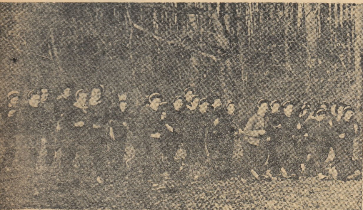
Competițiile de masă atrag în fiecare an tot mai multe tinere în activitatea sportivă. Cu prilejul lor s-au evidențiat numeroase elemente talentate care, mai tirziu, au urcat podiumul învingătorilor pe cele mai mari stadioane ale lumii. (Fotografia noastră reprezintă pe elevele din Brănești, concuring la cros în cadrul Spartachiadei de iarnă a tineretului).

Dar, parcă numai în Bucegi se adună prietenii sportului zăpezii? În munții Rodnei, pe coborișurile Gutinului, în Retezat sau pe coastele Semenicului concursurile sînt la fel de „tari”, la fel de pasionante.