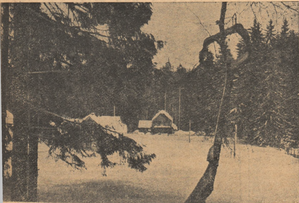
La ficcare sfîrșit de săptămînă oamenii muncii din regiunea Maramureș poposesc la două dintre cele mai primitoare cabane ale regiunii: Carpatina și Hutira de lângă localitatea Izvoarele. În imaginea noastră, cele două cabane în decorul fermecător al iernii