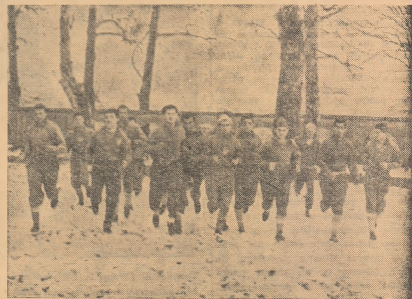
Aspect de la întrecerile de cros ale Spartachiadei? Nu! Un grup de fotbaliști de la Progresul la primul antrenament

Așteptăm să-i revedem lucrând cu același interes și la următoarele ședințe de pregătire și, mai ales, așteptăm roadele muncii lor.