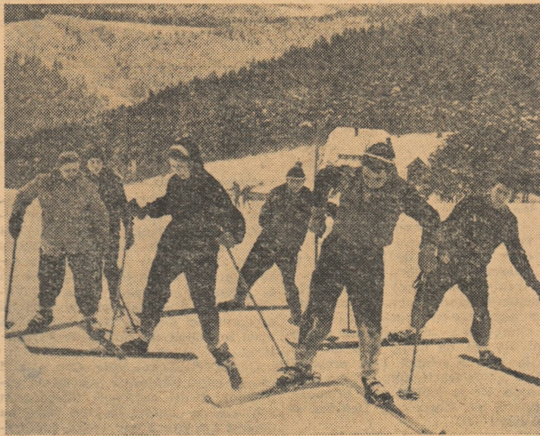
În zilele de vacanță studenții Institutului agronomic din Lützschen (R. D. Germană) au participat la o tabără de schi la Klingenthal, unde au învățat să schieze