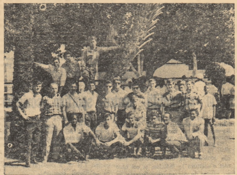
Jucătorii noștri în vizită la grădina zoologică din Khartum