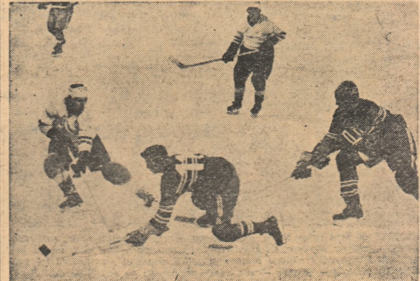
Recent, selecționata de hochei pe gheață a Bucureștiului a întreprins un turneu de patru jocuri în Austria și Italia. Sportivii români au obținut două victorii, un meci nul și o înfrângere, înscrind în total 18 goluri și primind 12. Acest turneu s-a desfășurat în cadrul pregătirilor echipei noastre reprezentative pentru campionatul mondial. ★ În fotografie, o fază din meciul contra lui W.E.V.G., care a revenit echipei noastre cu 6-2.