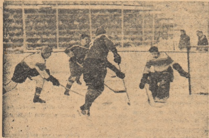
Aspect din meciul Steaua - Steagul roșu Brașov: atac al bucureștenilor la poarta oaspeților.

În meciul Steaua - Steagul roșu Brașov, atac al bucureștenilor la poarta oaspeților.