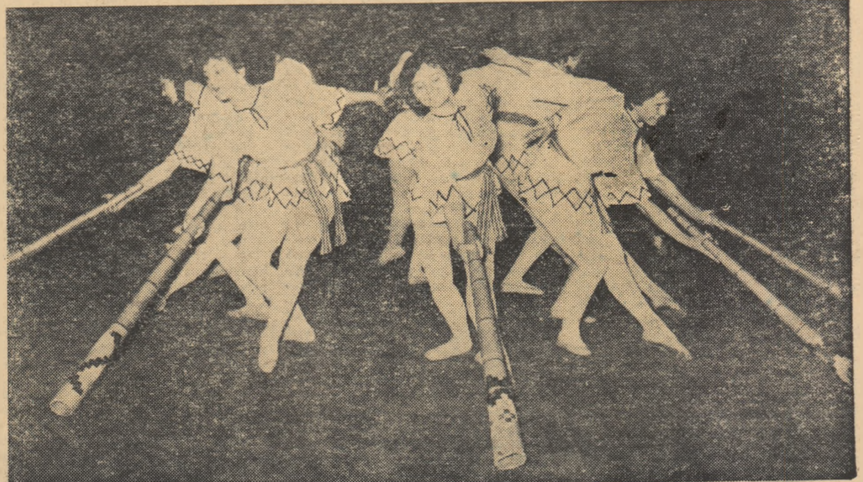
O reușită demonstrație de gimnastică artistică în deschiderea finalei din sala Floreasca: repriza de bucur-mași. Execută un grup de gimnaste de la Școala sportivă de elevi nr. 2.