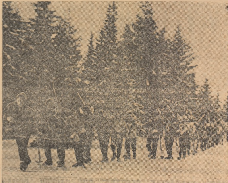
O imagine sugestivă surprinsă în Parînz: studenți de la Institutul de Cultură Fizică urcînd în monom către cabana Rusu...

denților noștri vor sta numeroase case de odihnă și cabane care vor oferi condiții excelente de recreare. Ca și în anii precedenți marea majoritate a studenților patriei se vor îndrepta către stațiunile de ne