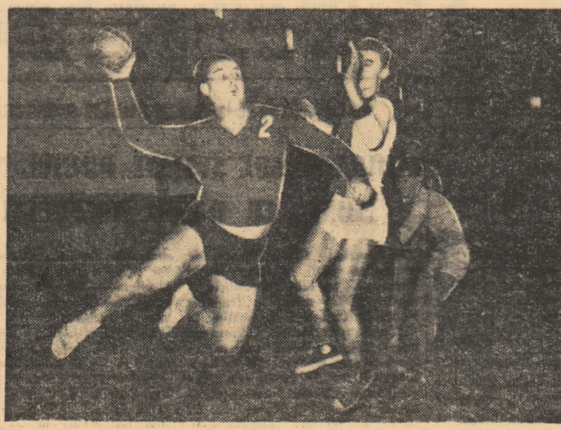
Fază din meciul Rapid București—Rafinaria Tebeș, disputat în sala Ploieșca

Întrecerile acestei competiții vor ajunge la selecționarea lotului de perspectivă pentru întîlnirile internaționale rezervate tinerilor popicari. Jocurile „Cupei 16 Februarie” încep simbătă la ora 9.30 și continuă duminică de la aceeași oră.