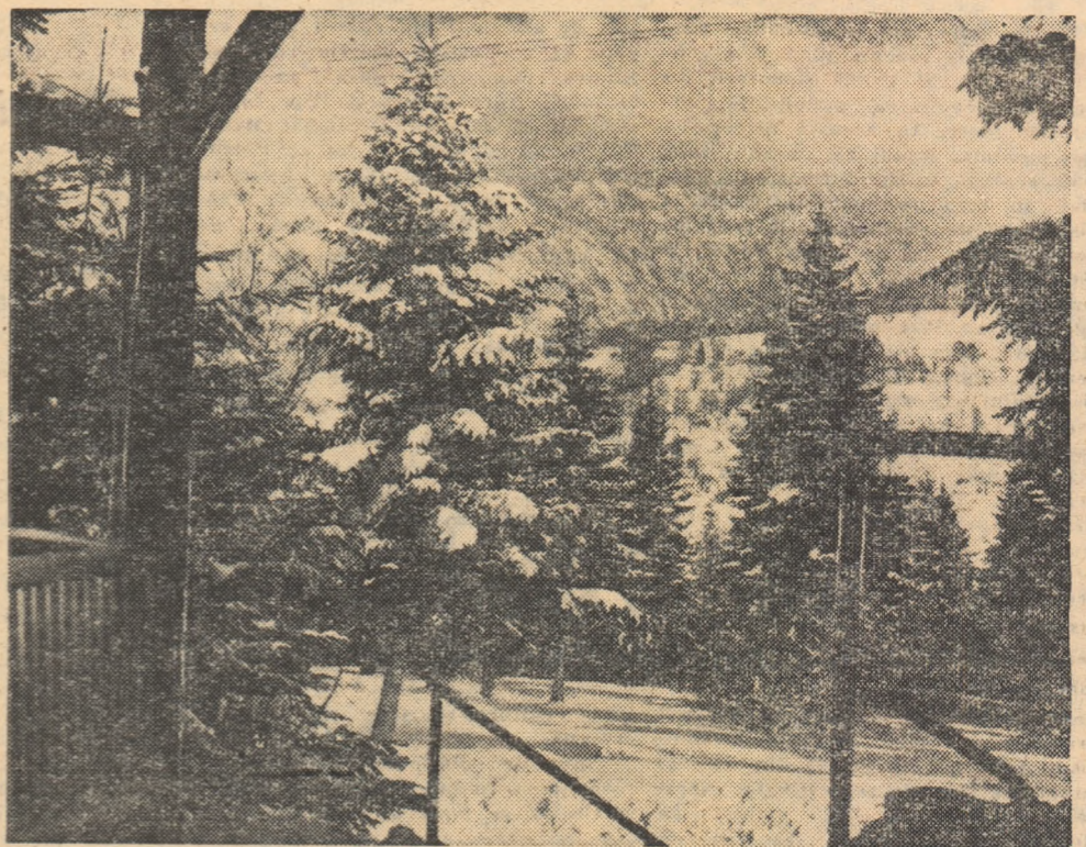
Pirtul roșu. Vedere de la cabana Cerbul spre Postăvar.