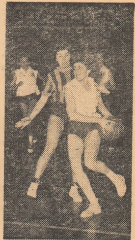
Imagine din meciul Rapid București—Partizan Novi Sad desfășurat aseară la sala Floreasca

Anul XIX—Nr. 4184 ● Simbătă 9 februarie 1963 ● 8 pagini 25 bani