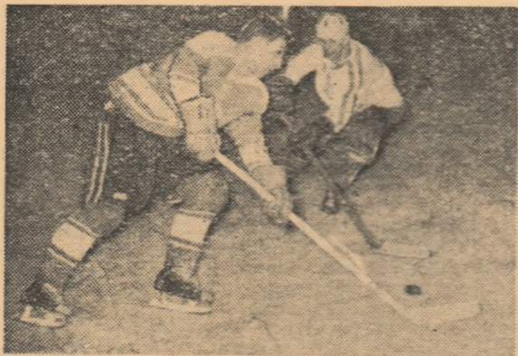
Și săptămîna trecută hocheiștii iugoslavi au mai evoluat în Capitală. În fotografie, un aspect din jocul Știința București—Steaua roșie Belgrad

Primul joc: azi la ora 18 pe patinoarul din parcul „23 August”