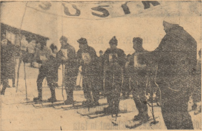
Plecarea în cursa de fond — schi